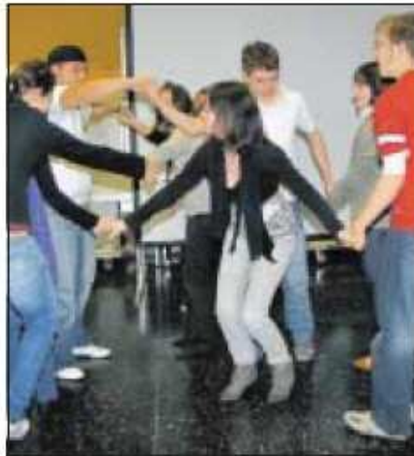
Bei dem Entwirren des „gordischen Knotens“ kam es auf die Teamfähigkeit der Teilnehmer an.