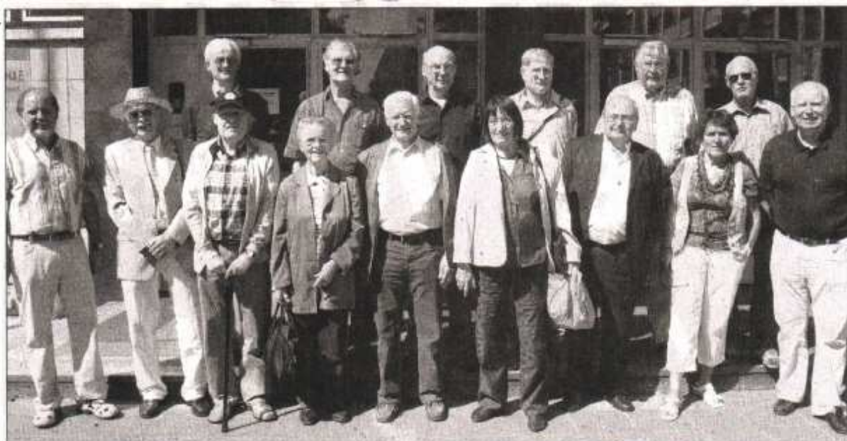
Gießener Allgemeine vom 30.06.2010