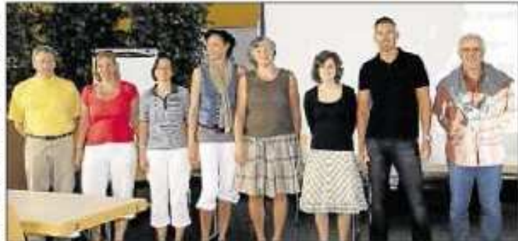
Vorbereitet für den Alltag: Lehrer der Friedrich-Feld-Schule.

In vier Workshops wurden Teilaspekte der Gesamtproblematik in Theorie und noch mehr in der Praxis aufgearbeitet. Bei „Stabiler Rumpf ist Trumpf“ ging es um die Anatomie der Wirbelsäule und Fehlbelastungen, die durch richtiges Stehen und dynamisches Sitzen abgemildert werden können. Denn wenn es schmerzt, ist es oft zu spät. Dass auch auf die Ver-