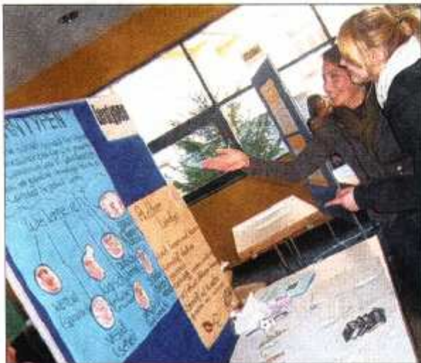
Lernen kann auch Spaß machen. An der Friedrich-Feld-Schule lässt sich das am Samstag nachprüfen.

Am Samstag kann man sich bei Schülern und Lehrern informieren, die einzelnen Schulformen kennenzulernen und die Vorzüge verschiedener Schulformen abwägen ( www.ffi-giessen.de ).