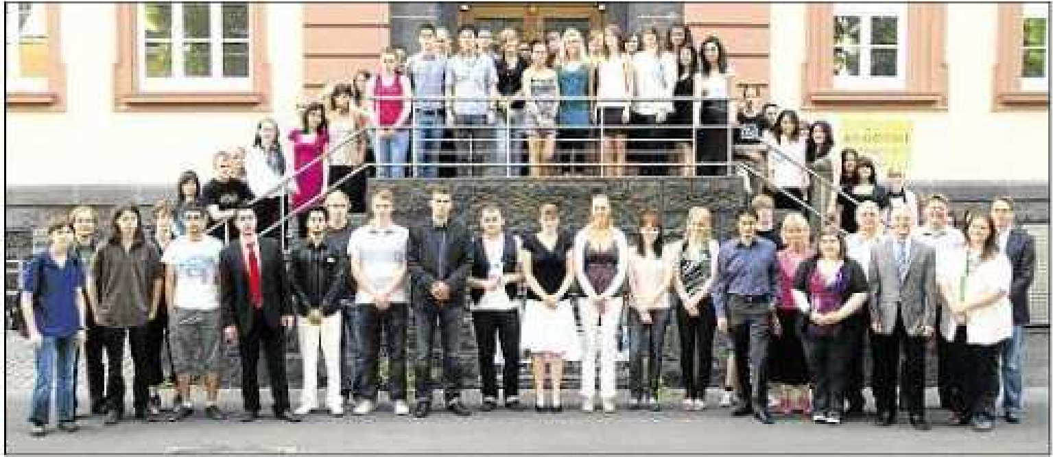
Die erfolgreichen Absolventen der höheren Berufsfachschule der Friedrich-Feld-Schule